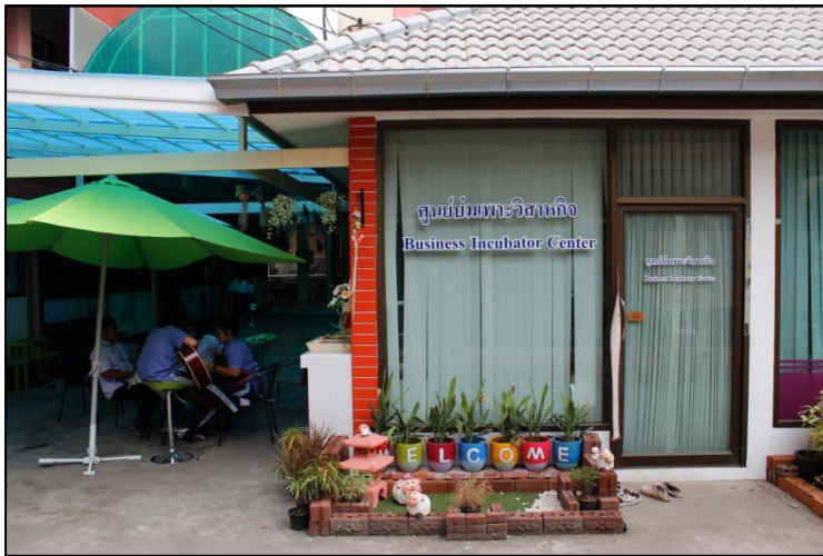
ศูนย์บ่มเพาะวิสาหกิจ ตั้งอยู่ข้างอาคาร 4