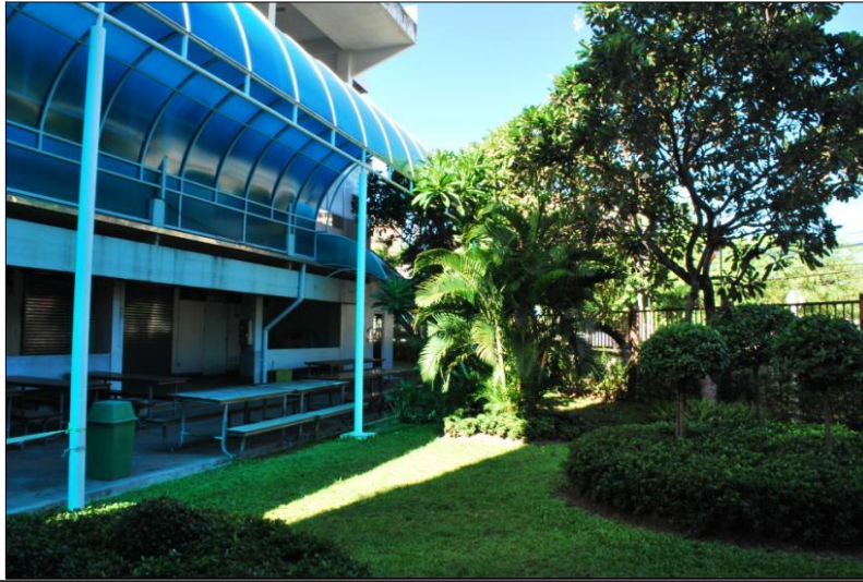
สวนหย่อมหน้าอาคาร ๓