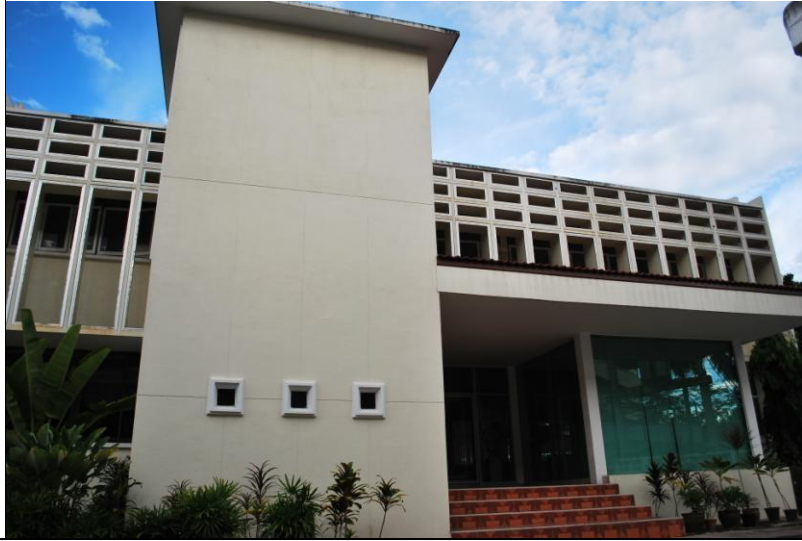
อาคารศูนย์ปฏิบัติการ อาหาร (ปิดปรับปรุง)