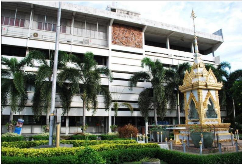
สวนหย่อมหน้าอาคาร ๔ และหอพระ