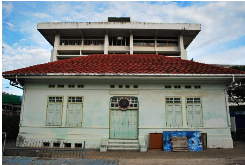
อาคารไปรษณีย์เดิม (กำลังดำเนินการเป็นหอศิลป์)