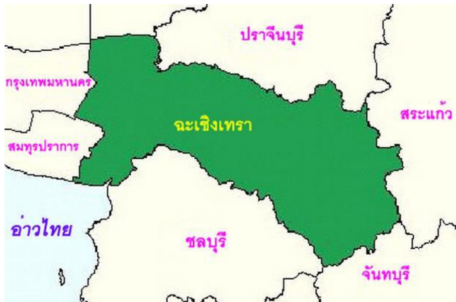
รูปที่ ๑ แสดงแผนที่ตั้งจังหวัดฉะเชิงเทรา