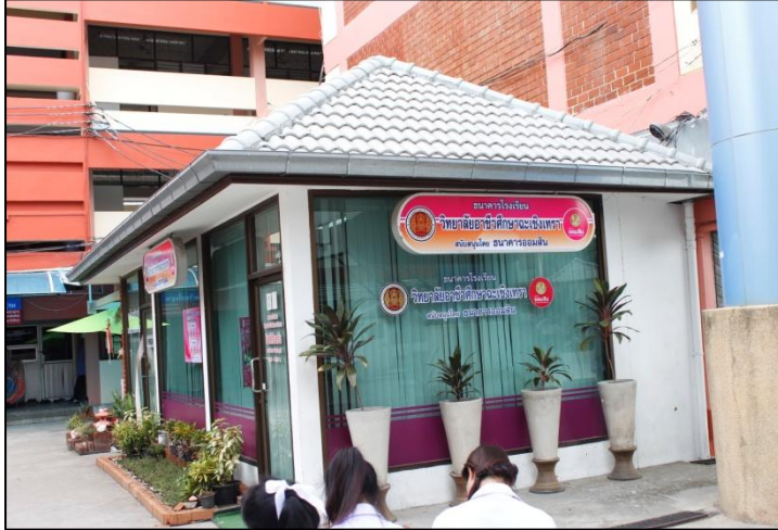
ธนาคารโรงเรียน ตั้งอยู่ข้างอาคาร 4