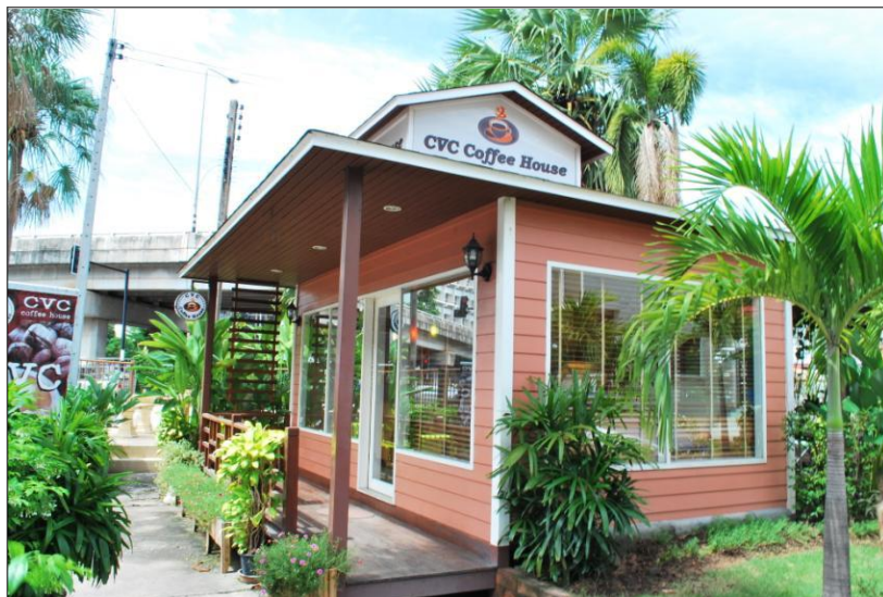
ร้าน CVCoffeeHouse (งดให้บริการชั่วคราว)