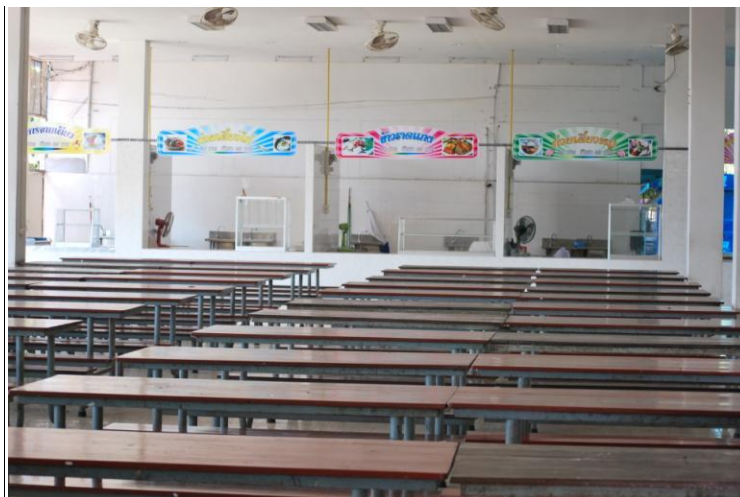
โรงอาหาร 1 ตั้งอยู่ด้านหลังอาคาร 4